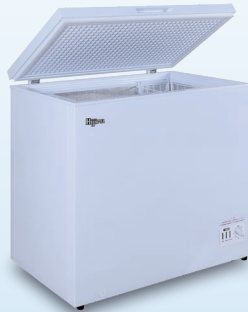
C 211 ℓ HJR-NM211