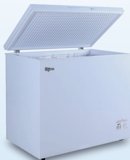
D 280 ℓ HJR-NM280