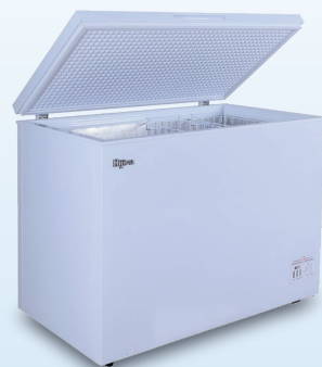
E 330 ℓ HJR-NM330