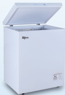
B 150 ℓ HJR-NM150