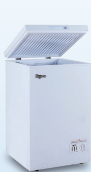
A 101 ℓ HJR-NM101